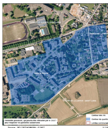
Louviers, Maison rouge